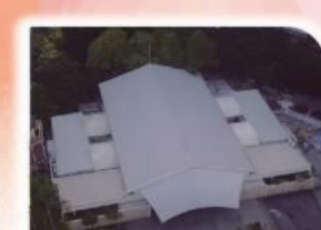
12 扩张帐幕得地为业