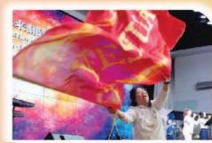
4 实习操练 Being 化