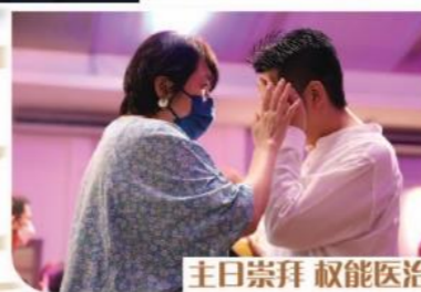
主日崇拜 权能医治 香柏牧区 证道