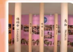
9 五重恩赐团队恩膏