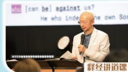
释经讲道课 线上分享默观基督营