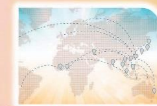
1 穿越疫情全地收割