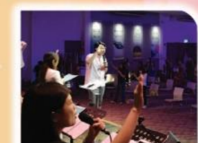
5 以教会为训练基地