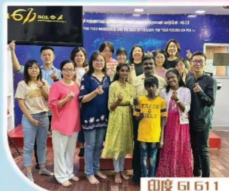
印度 G1 611 新山 G1 611