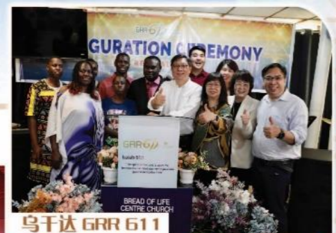
乌干达 GRR 611