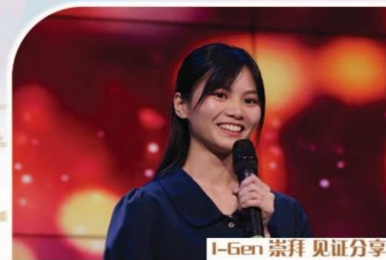
I-Gen 崇拜 见证分享