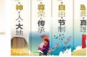
11 核心价值建造根基