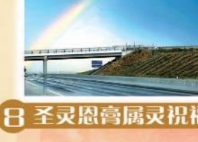
8 圣灵恩膏属灵祝福