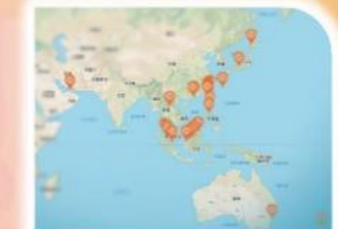
7 宣教植堂属灵祝福