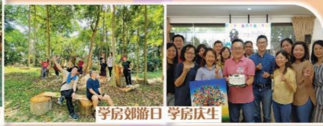
学房郊游日 学房庆生