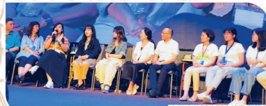
古晋生命树心版十诫敬拜特会 西乃山之旅