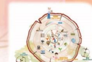
10 MG 门徒收养架构