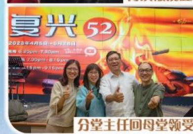
分堂主任回母堂领受 学房生分享见证