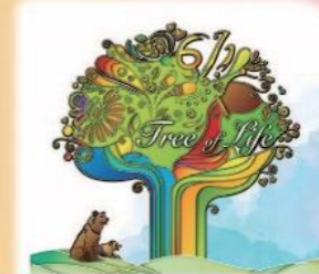
2 以生命树气息为本