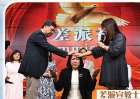
差派宣教士 加纳 GRS 611