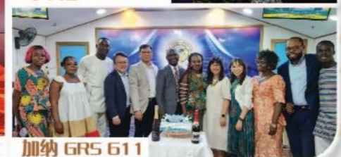
加纳 GRS 611