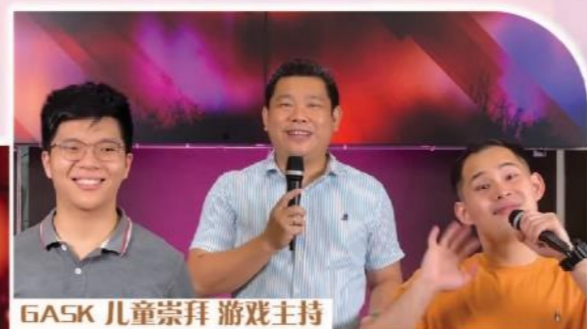
GASK 儿童崇拜 游戏主持