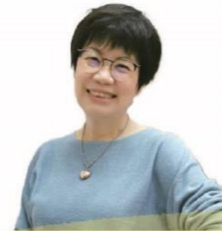
先知的话 董帖心牧师