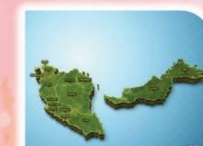
6 以马来西亚为创校地点